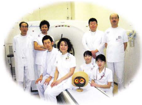
放射線科スタッフ

マンモグラフィは女性技師が撮影を行っています。近年増加の一途をたどる乳がんですが、当院では読影認定医師、撮影認定技師とともに健診施設画像認定も取得し、乳がん撲滅のためにスタッフ一同「ちから」を合わせて取り組んでいます。