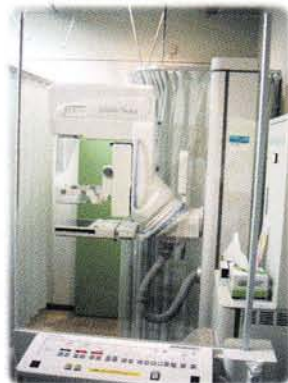
マンモグラフィー