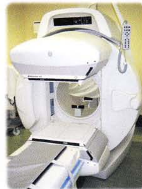
核医学ガンマーカメラ