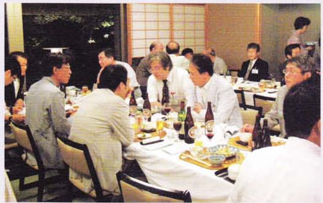
日本庭園を眺めつつ和室での懇親会